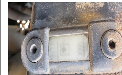
FOTO NIVEL ACEITE MOTOR