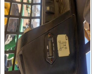
FOTO NIVEL ACEITE HIDRAULICO