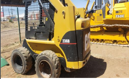
FOTO LADO DER.